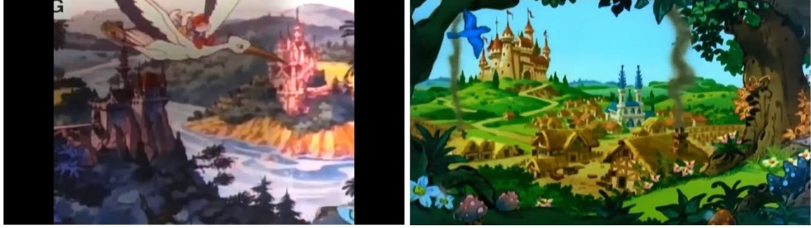
Resim 1: Ön Jenerik başlangıcında vurgulanan kapitalist dünya

Şirinler isminin açılımında komünizme dair net bir ifade yer almasa da dizinin ana unsurları içerisinde bu izleri görmek mümkündür. Örneğin barınma hakkı ve konut sorununun devlet tarafından ülke halkına ücretsiz sağlanıyor olması komünizm manifestosunun temel yapı taşları arasında yer almaktadır. Şirinler dizisinde de ilk dikkati çeken yaşadıkları çevre olabilir. Şirinler evreninde kullanılan ön jenerik videolarının açılış sahnelerinde zenginlik ve lüksün hakim olduğu saray ve kent yaşamı gösterilmektedir (Resim:1).