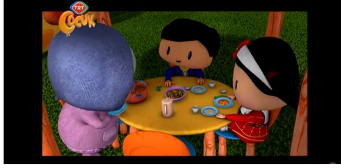
Resim 14: Pepee kuru fasulye yiyor.

Sezon 01, Bölüm 14 – Yaşasın Yemek Yemek