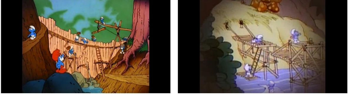
Resim 8: Kolektif çalışma prensibiyle paylaşım ekonomisine destek olan topluluk üyeleri

Komünizm öncülerinden Karl Marx, “Zaman içerisinde para, metalar gibi insanların da değerlerini belirleyen, herkesin üzerinde bir güç gibi görünmeye başlar. Para artık tanrı gibidir.” sözü ile sınıf farklılıklarının doğmasındaki en temel sebebi olarak parayı işaret eder. Şirinler dünyasında para yoktur, yapılan işler bedelsizdir, köyde kolektif yaşam hakim sürer (Resim 8).