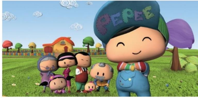
Resim 12: Pepee'nin ailesi

Pepee evrenine genel olarak bakıldığında orta sınıf bir Türk ailesi ile karşılaşılır. Çekirdek aile temelli, kuvvetli aile bağlarının sürekli vurgulandığı yaşam tarzı hakimdir. Hanede bir erkek çocuk ve kız bebek kardeşi mevcuttur, bunlara anne ve baba ile anne-baba işe gittiğinde çocuklara bakan dede ile nine eklenir. Programın dış sesi, çocukların hayal arkadaşları, akrabaları, yakın arkadaşları, öğretmenleri ve evcil hayvanları da eklenerek içerik zenginleştirilmesi yapılmıştır (Resim 12).