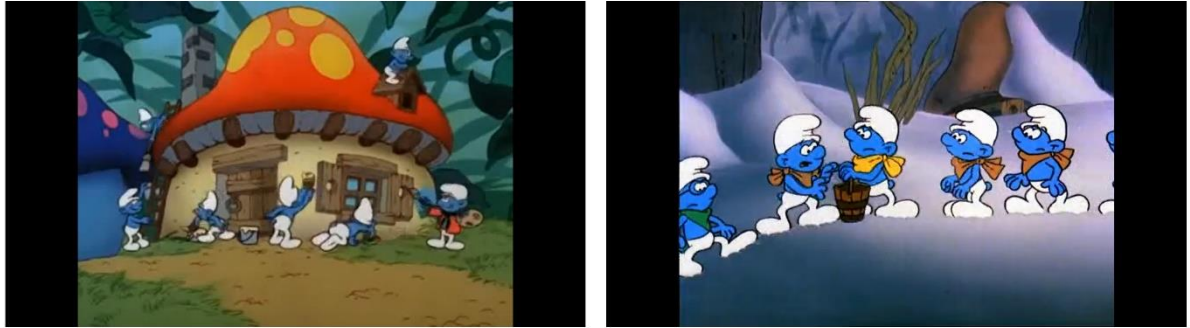
Resim 7: Farklı yeteneklerin toplam faydaya etki edecek şekilde bir arada var olması

Topluluk içerisinde temel katkı sağlama odaklı her bireyin farklı yetenekleri bulunur ve bu yetenekler sadece ilgili şirine mahsustur. Çiftçi, sanatçı, mimar, müzisyen, aşçı, şair, ressam gibi temel mesleki uzmanlık alanları olan şirinler çıkar karşımıza (Resim 7).