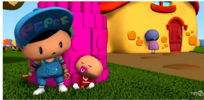
Resim 13: Babaanne Pepee'ye saklambaç oynamayı öğretiyor. Sezon 01, Bölüm 13 – Pepee saklambaç oynuyor.

Bölüm içeriklerinde geçen öğeler Milli kültür ve değerler esasında işlenmiştir. Oynanan oyunlar Türk kültürü temelli oyunlardır (Resim 13).