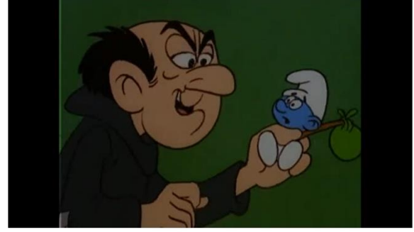
Resim 11: Komünizm zıttı ifade biçimi ile Şirinler'in düşmanı: Gargamel

Sol Resim: Sezon 01, Bölüm 07 – Büyülenmiş, Rahatsız ve Şirinlenmiş (Bewitched, Bothered and Bewitched) Kaynak: