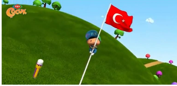
Resim 16: Pepee açılış jeneriğinde Türk Bayrağından kayarak gelir.

çizgi dizi Milliyetçi temeller üzerine inşa edilmiştir. Örneğin; İlk sezon jeneriğinde Pepee Türk bayrağından inerek seyirciyi selamlar (Resim 16).