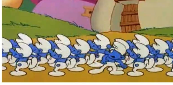
Resim 10: Ortak modelde, özgürlük ve devrim sembolü Frigya şapkası takan şirinler Sezon 01, Bölüm 20 – Sahte Şirin (The Fake Smurf)

Şapkanın kullanım anlamlarından birisi de özgürlük imgesi olarak belirtilmektedir. Romalılar başlığı bu amacı simgelemek için takmışlardır. Hatta 18.yy.'da Amerika'nın Bağımsızlık savaşı sırasında özgürlük bayrağına da asılı bırakılmıştır (Wikipedi, 2020). Bir devrim simgesi olarak komünistlerin de gayri resmi şapkası olarak düşünülebilecek bu şapka çizgi dizideki tüm şirinlerin başında yer alır.