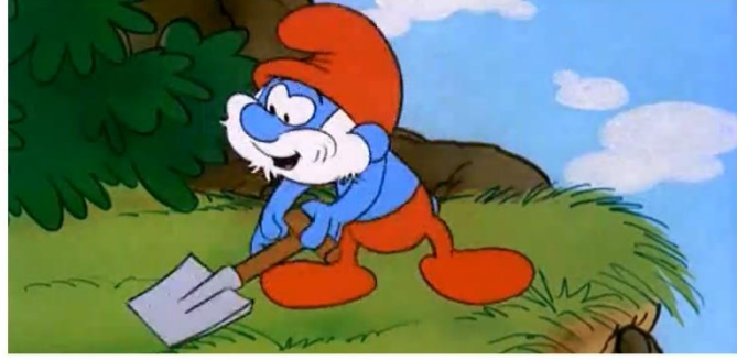
Resim 9: Tek farklı giyim tarzıyla topluluğun bağlı olduğu bilge baba; Şirin Baba Sezon 01, Bölüm 24 – Mor Şirinler (The Purple Smurfs)

ve işleyişin yol haritasını şirin baba çizer her zaman. Önemli kararlardan, düzenden ve güvenden o sorumludur. Köy içerisinde büyü yeteneğine de sahip ana karakterdir. Köyün en yaşlı karakterinin şirin baba olduğu söylenebilir. Şirin Baba diğer tüm şirinlerden farklı renk giyimi ile ayrılır. Diğer şirinler beyaz giyinirken Şirin Baba ise kırmızı giyinmektedir (Resim 9).