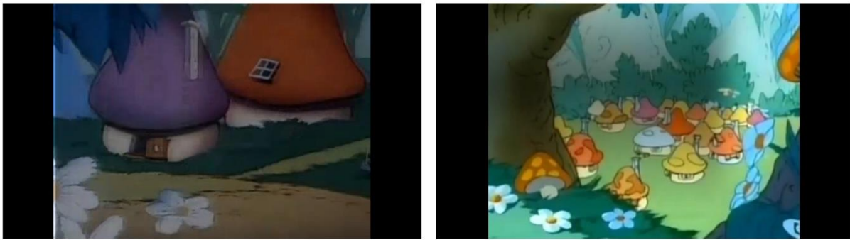
Resim 2: Doğal yaşam alanları ve mülkiyet eşitliği

Fakat Şirinler bu bölgede yaşamamaktadırlar. Tüm şirinlerin bir arada yaşadıkları gizli bir köy bulunur ormanın derinliklerinde. Yaşam alanları, doğal yaşam alanları olarak aktarılır; evler beton yapıda değildir, renkli mantarların içerisine inşa edilmiş tek tip evlerdir. Mülkiyet yoktur, herkes eşit şartlardaki evlerinde barınma ihtiyacını karşılar (Resim 2).