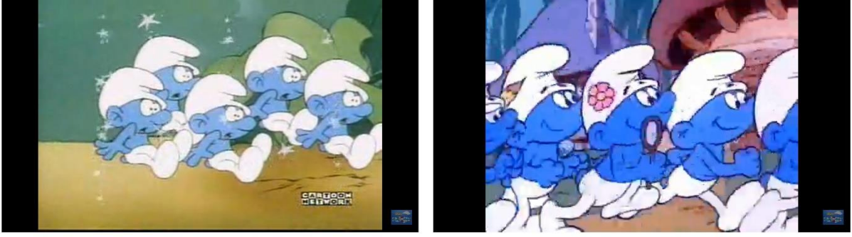
Resim 5: Evrensel eşitlik ilkesinden hareketle ortak fiziksel özellikte kurgulanmış karakter tasarımları

Evrensel eşitlik, komünist bakış açısının temel odak noktalarındandır. Dizinin ana karakterleri şirinlerin renkleri de ortak özellikte; mavi renktedir. Fizyolojik özelliklerinin de neredeyse hemen hemen aynı olduğu söylenebilir. Saç, sakal, gözlük v.b. çok temel farklılıklar dışında tüm şirinler aynı görüntüde çizilmişlerdir. Dini temellerde inanç farklılıkları dahi bulunmamaktadır (Resim 5).