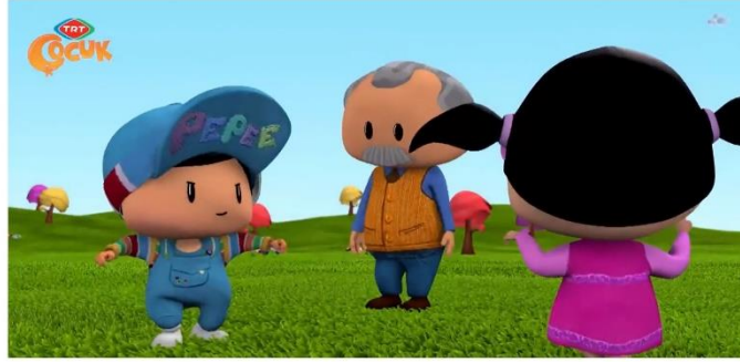
Resim 15: Pepee Hüdayda müziğinde dans ediyor.

Sunulan danslar yöresel danslardır (Resim15).