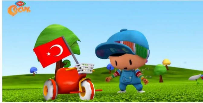
Resim 17: Pepee kırmızı rengi öğrenir ve Türk bayrağını örnek verir.

Bölüm ismi de Türk bayrağıyla birlikte belirir. Renkleri öğrettiği bölümde ilk renk kırmızı, ilk örnek ise yine Türk bayrağıdır (Resim 17).